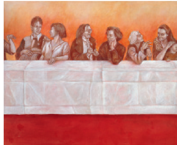
Ausschnitt „Frauenaltar“ von Candace Cater in Stein

30.10.2011 (Vorabend des Reformationstages) 18:00 - 20:00 Uhr (Einlass ab 17:00 Uhr) Blauer Saal, Haus der EKD am Gendarmenmarkt Charlottenstr. 53/54, 10117 Berlin