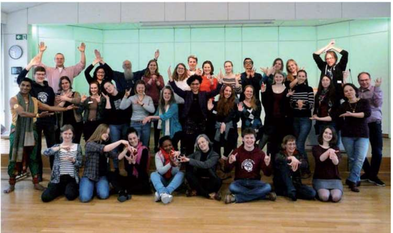
Teilnehmer*innen der internationalen Konferenz