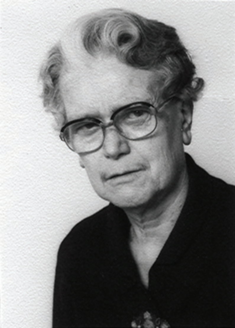
Abbildung 4: Margarete Schuster (1899–1978), Theologin