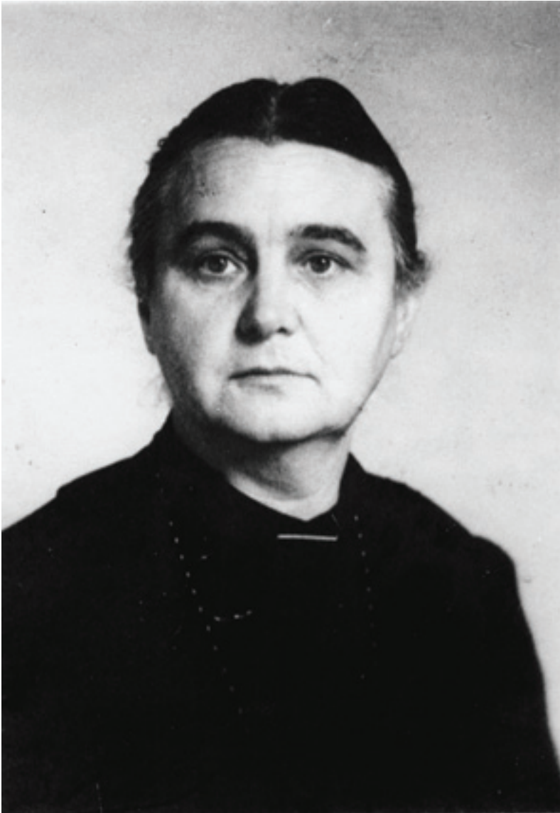
Abbildung 3: Margarete Braun (1893–1966), Theologin