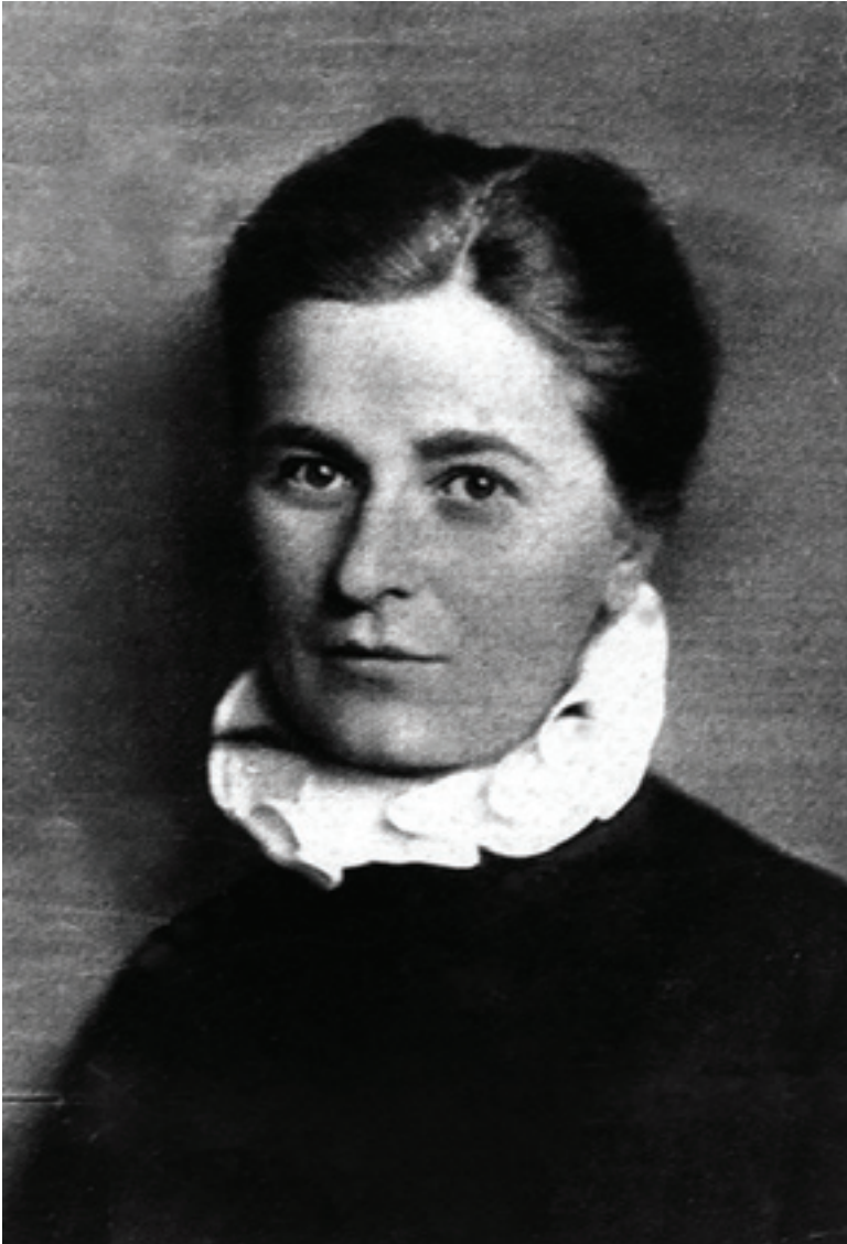
Abbildung 2: Sophie Kunert (1896–1960), Hamburgs erste Theologin